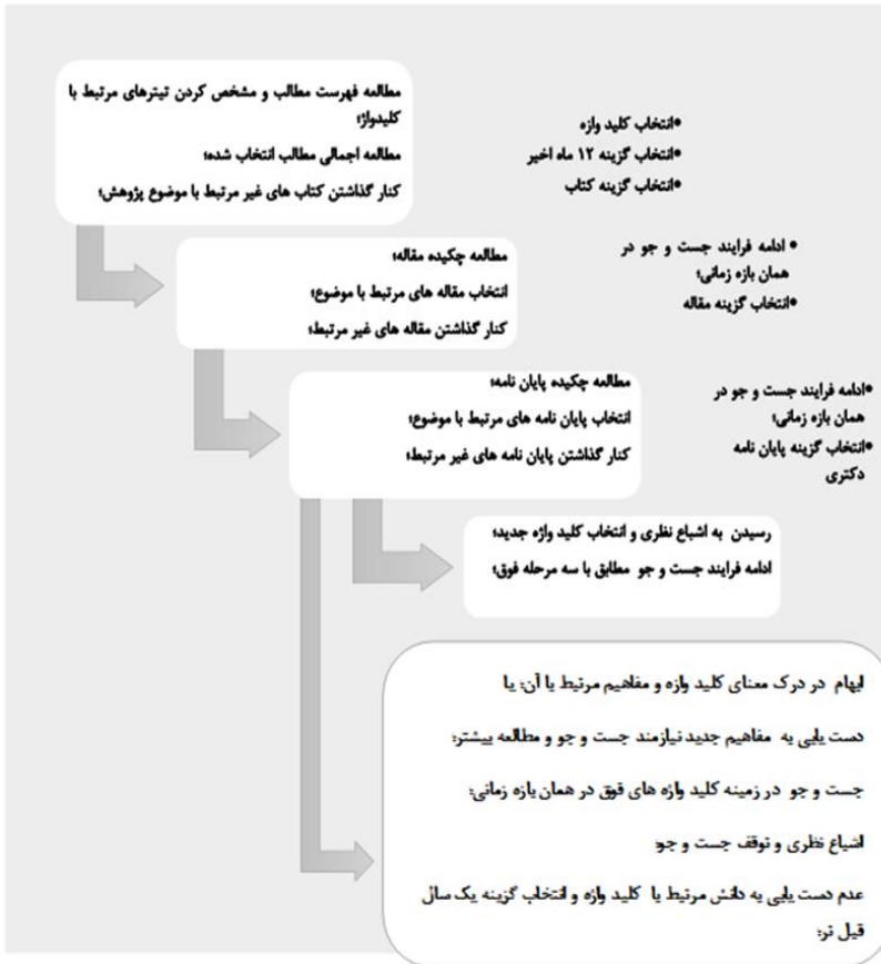
شکل ۱: فرایند جست و جوی منابع مرتبط با کلید واژه‌ها

تی‌پک، برنامه درسی آموزش عالی و پداگوژی، پداگوژی آموزش عالی، مدل‌های پداگوژی، و انواع پداگوژی مورد جست و جو قرار گرفتند. در فرایند جست و جو مراحل متوالی مطابق شکل ۱ طی شده است.